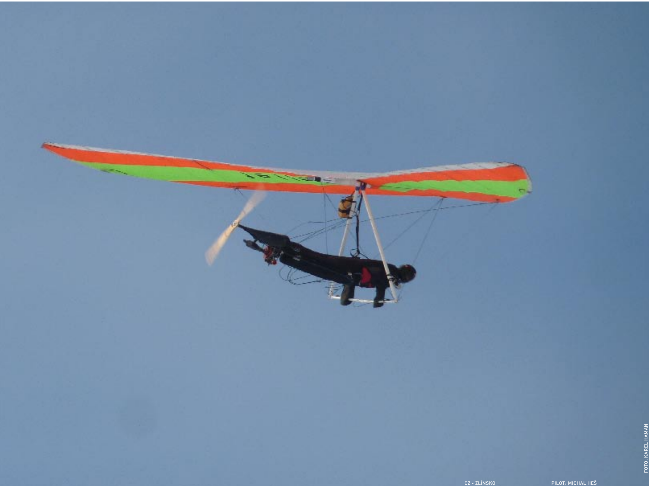
CZ - ZLÍNSKO