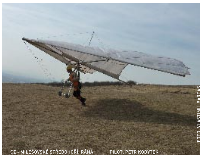
CZ - MILEŠOVSKÉ STŘEDOHŘÍ, RÁNA PILOT: PETR KODÝTEK