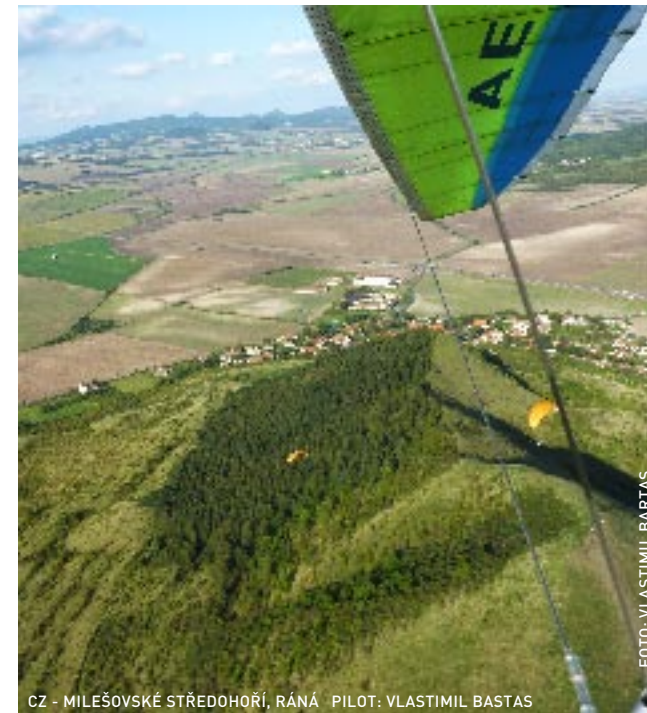
CZ - MILEŠOVSKÉ STŘEDHOŘÍ, RÁNA PILOT: VLASTIMIL BASTAS