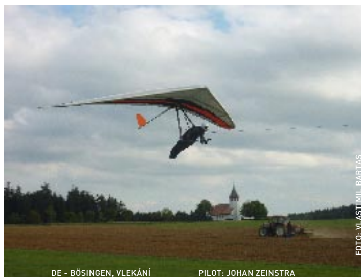
DE - BÖSINGEN, VLEKÁNÍ