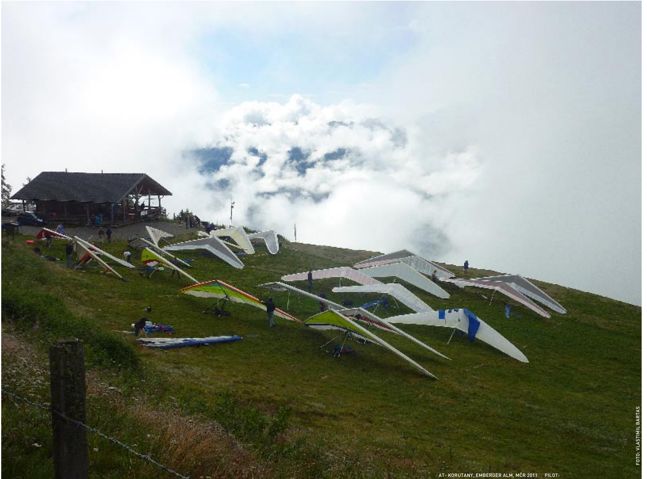
AT - KORUTANY, EMBERGER ALM, MČR 2011 PILOT: