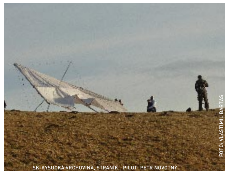
SK-KYSUCKÁ VRCHOVINA, STRANÍK PILOT: PETR NOVOTNÝ