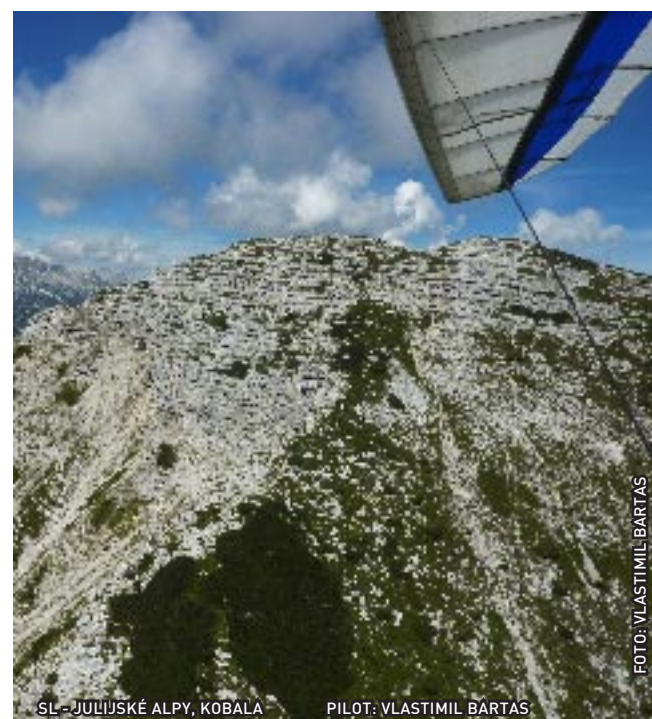
SL - JULIJSKÉ ALPY, KOBALA PILOT: VLASTIMIL BARTAS