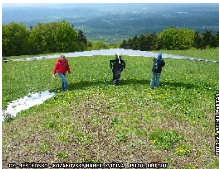
CZ - JEŠTĚDSKO - KOZÁKOVSKÝ HRBET, ZVIČINA