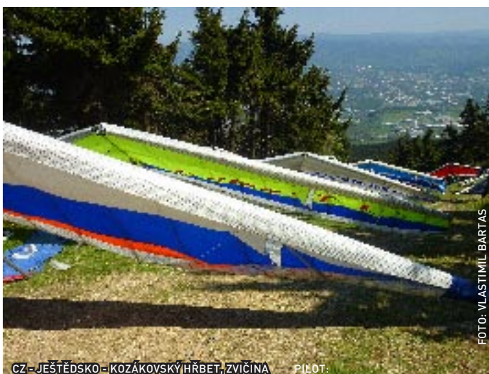
CZ - JEŠTĚDSKO - KOZÁKOVSKÝ HRBET, ZVIČINA