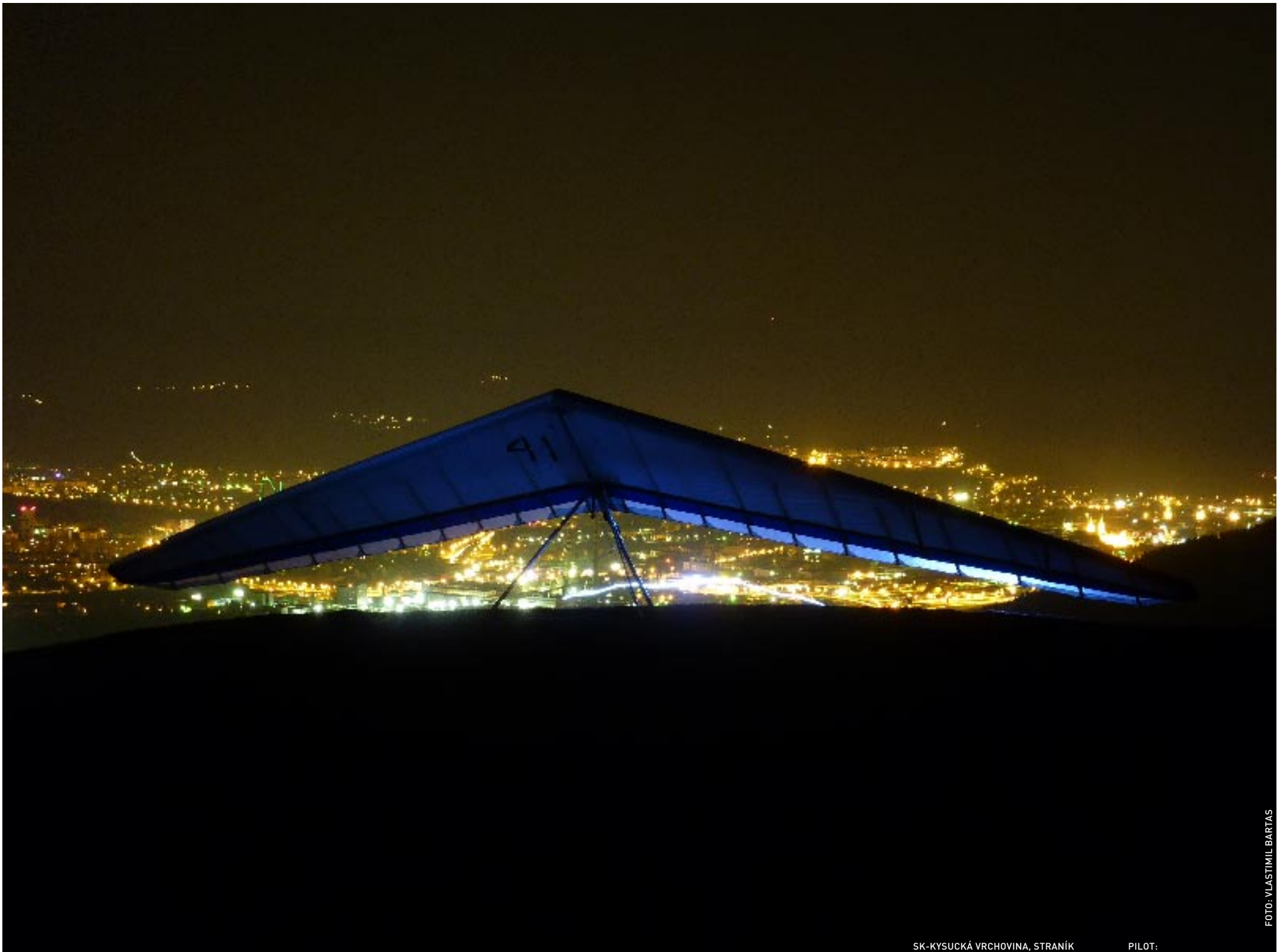
SK-KYSUCKÁ VRCHOVINA, STRANÍK