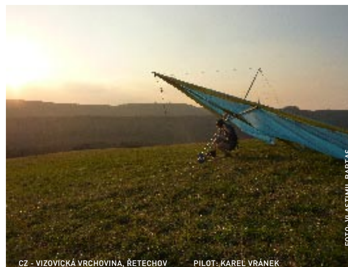
CZ - VIZOVICKÁ VRCHOVINA, ŘETEHOV