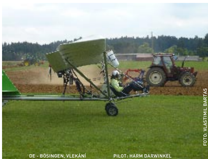
DE - BÖSINGEN, VLEKÁNÍ