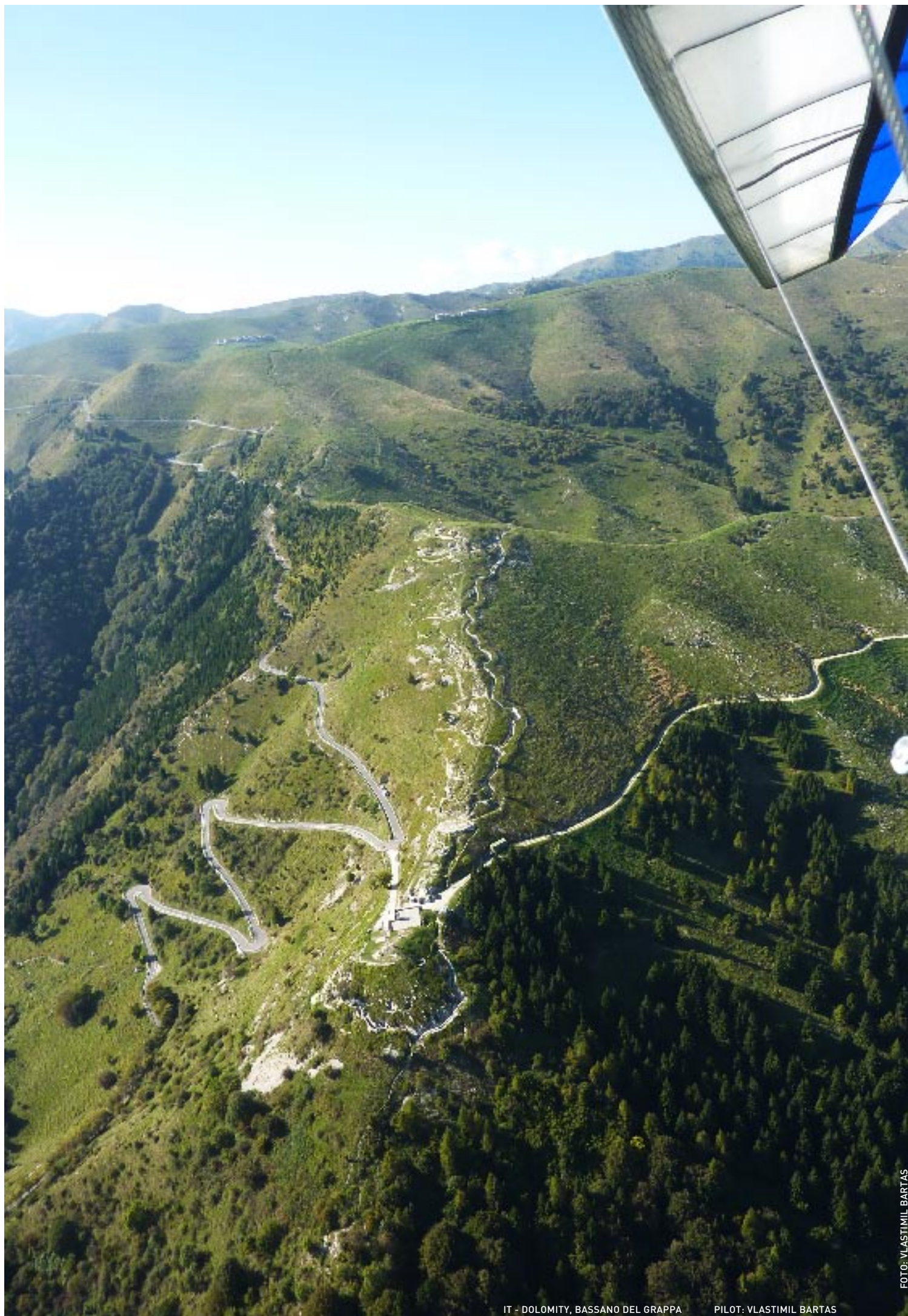
IT - DOLOMITY, BASSANO DEL GRAPPA PILOT: VLASTIMIL BARTAS