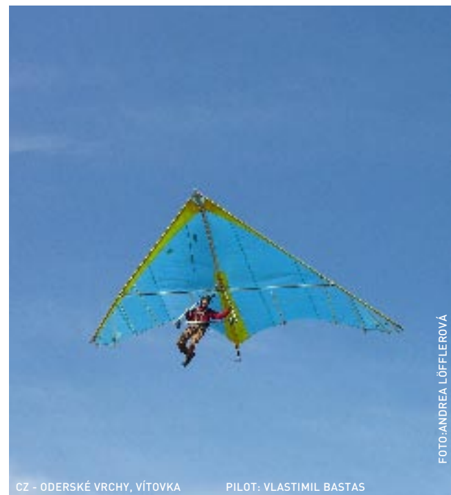
CZ - ODERSKÉ VRCHY, VÍTOVKA PILOT: VLASTIMIL BASTAS