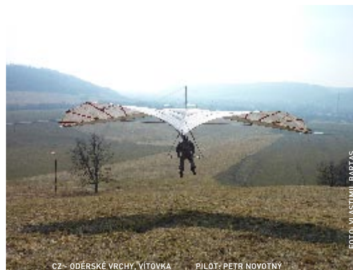
CZ- ODĚRSKÉ VRCHY, VÍTOVKA PILOT: PETR NOVOTNÝ