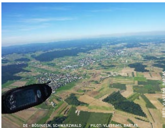
DE - BÖSINGEN, SCHWARZWALD PILOT: VLASTIMIL BARTAS