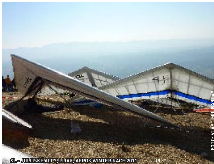
SL - JULIJSKÉ ALPY, LIJAK, AEROS WINTER RACE 2011 PILOT: