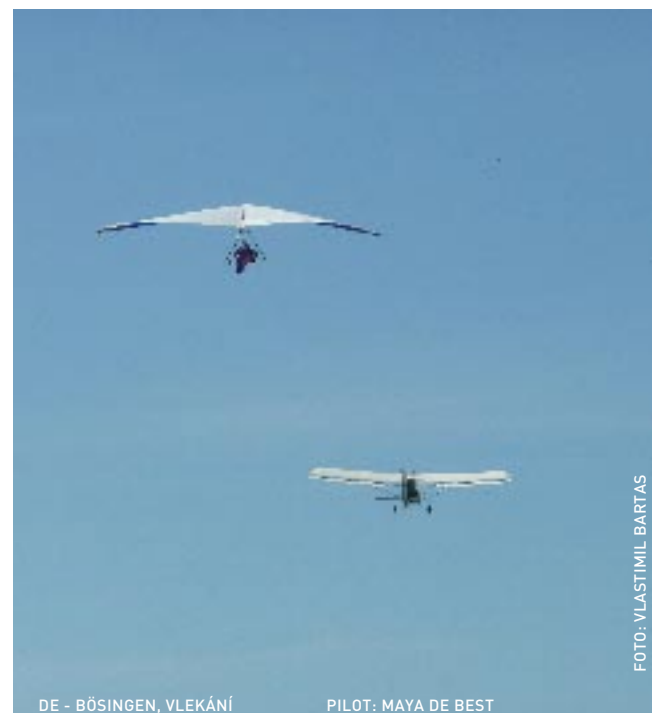
DE - BÖSINGEN, VLEKÁNÍ PILOT: MAYA DE BEST