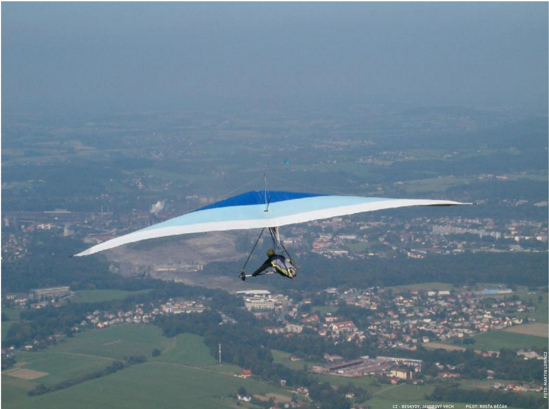
CZ - BESKYDY, JAVOROVÝ VRCH PILOT: ROŠTA BĚČÁK