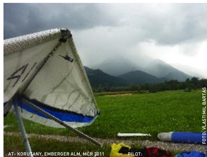
AT - KORUTANY, EMBERGER ALM, MČR 2011