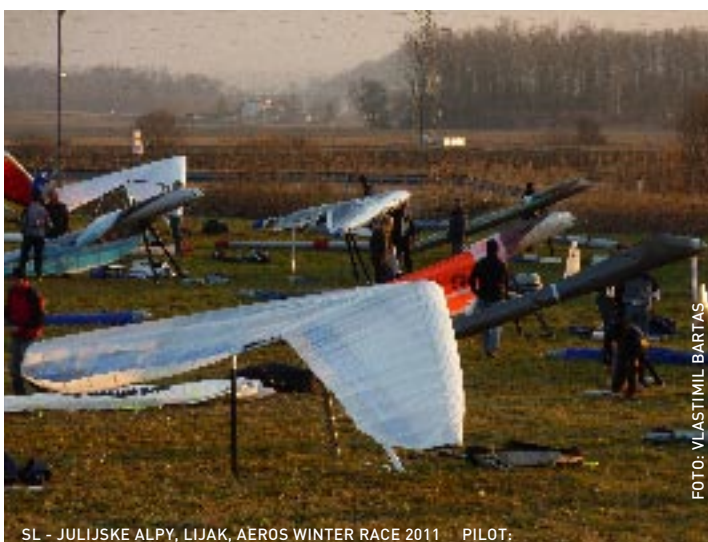
SL - JULIJSKE ALPY, LIJAK, AEROS WINTER RACE 2011 PILOT: