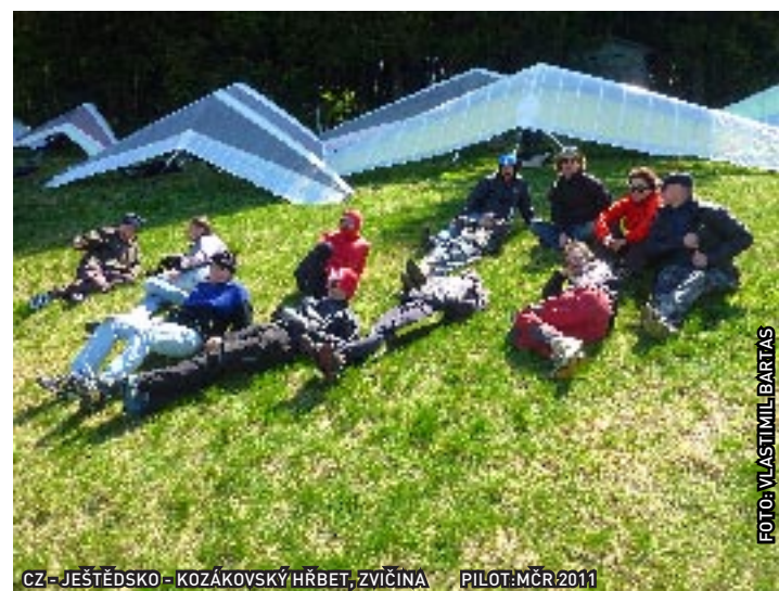
CZ - JEŠTĚDSKO - KOZÁKOVSKÝ HRBET, ZVIČINA PILOT: MČR 2011