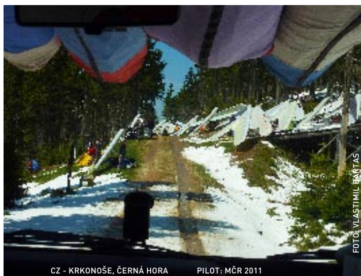
CZ - KRKONOŠE, ČERNÁ HORA PILOT: MČR 2011